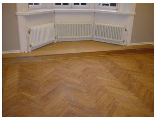
Nischbänkar i olika utföranden.