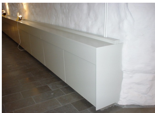
Gavelstycke för inklädnad.