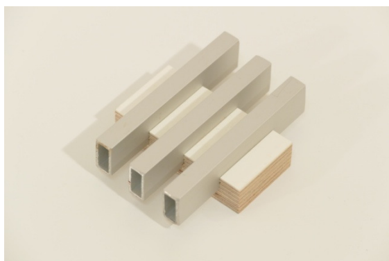
Konvektorgaller i naturanodiserat utförande 20x10 mm, finns även vita samt 3x20 mm.