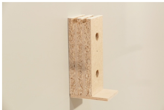
Exempel på distanskloss, finns i flera djupmått.